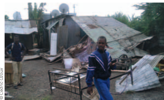
Des bangas détruits par un collectif mahorais, mai 2016.

un acte illégal... et il ne se passe rien », dénonce La Cimade. Les « décasés » ainsi poursuivis ont bien tenté de réagir. Le 22 février, une cinquantaine de réfugiés, dont 32 enfants, se sont rendus au siège de La Cimade, à Mamoudzou,