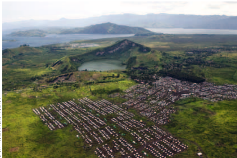
Camp de Mugunga en République Démocratique du Congo.

L'exposition Habiter le campement fait découvrir la diversité des formes d'habitat précaire : certains l'ont choisi, d'autres le subissent, juste pour un temps ou pendant très longtemps.